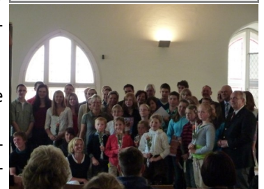
Gruppenfoto der Preisträger